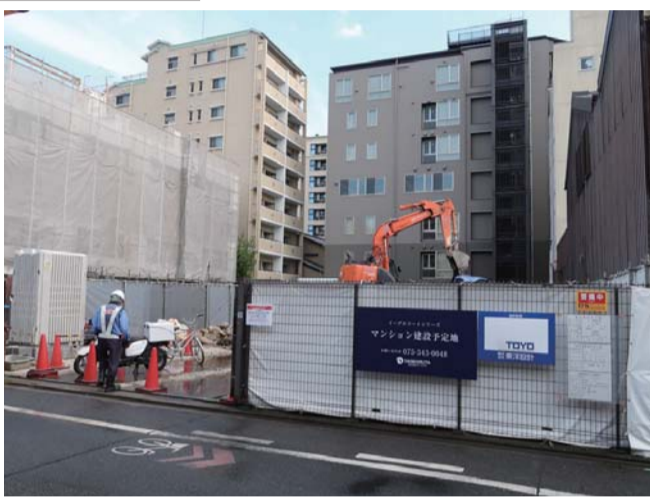
押小路通沿いの計画地(中京区)