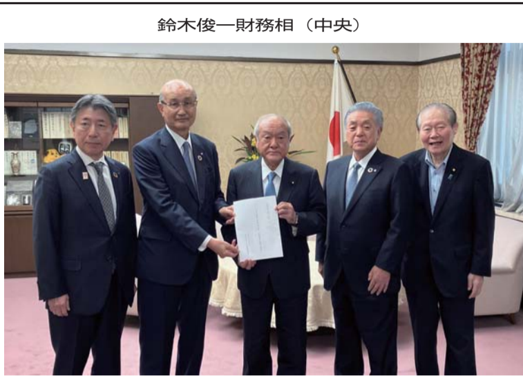
鈴木俊一財務相(中央)