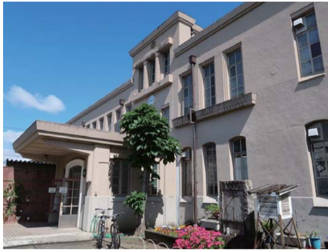
元新洞小学校の校舎 (本館)

京都市は20日、元新洞小学校跡地活用に係る契約候補事業者選定のための募集要項案を明らかにした。募集要項案を公開して審査。審査項目及び審査基準案を非公開で審議した。市が示した募集要項案によると、募集対象とする事業は①京都市の政策課題への対応に資すること(ア・敷地を最大限に生かした活用、イ・避難所、その他防災上の機能強化、ウ・地域経済への貢献、エ・文化の継承・活用及び創造、オ・環境に配慮した取組の推進)②地域コミュニティの活性化に資すること(ア・地域住民が利用する施設の整備、イ・施設等の整備、維持管理、ウ・地域住民との円滑な関係の構築)③次世代の新たな活力を生み出す空間の創出、大学・学生等との協働による魅力あるまちづくりに資すること。上記事業以外の機能を含めた複合的な施設の整備など、対象物件を幅広く活用する事業を提案することも可能。ただし、宿泊施設については、